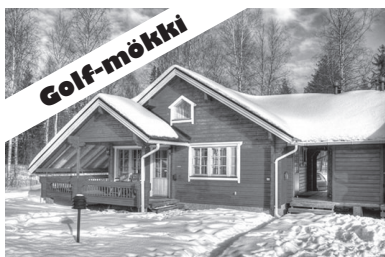
Tammisaloon Ski ja Tammisaloon Golf

Tammisaloon VPK tekee merkittävää paikallista nuorisotyötä ja tarjoaa maksuttoman harrastusmahdollisuuden Tammisaloon ja lähialueiden lapsille ja nuorille. Järjestämme myös taloyhtiöille ja yhdistyksille maksutonta paloturvallisuus- ja alkusammutuskoulutusta. Olemme lisäksi kaikkina vuorokauden aikoina valmiina lähtemään kol-