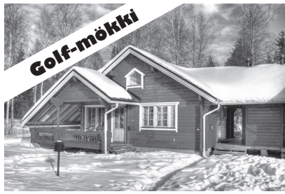
Tammisaloon Ski ja Tammisaloon Golf

Tammisaloon VPK tekee merkittävää paikallista nuorisotyötä ja tarjoaa maksuttoman harrastusmahdollisuuden Tammisaloon ja lähialueiden lapsille ja nuorille. Järjestämme myös taloyhtiöille ja yhdistyksille maksutonta paloturvallisuus- ja alkusammutuskoulutusta. Olemme lisäksi kaikkina vuorokauden aikoina valmiina lähtemään kol-