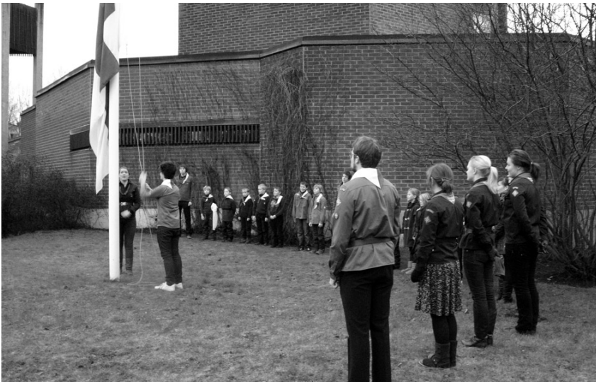
Itsenäisyyspäivän lipunnosto Tammisaloon kirkolla